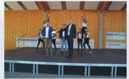
Teugonia beim Testen der neuen Bühne