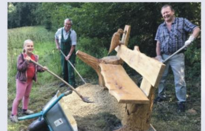
OGV mit fleißigen Helfern